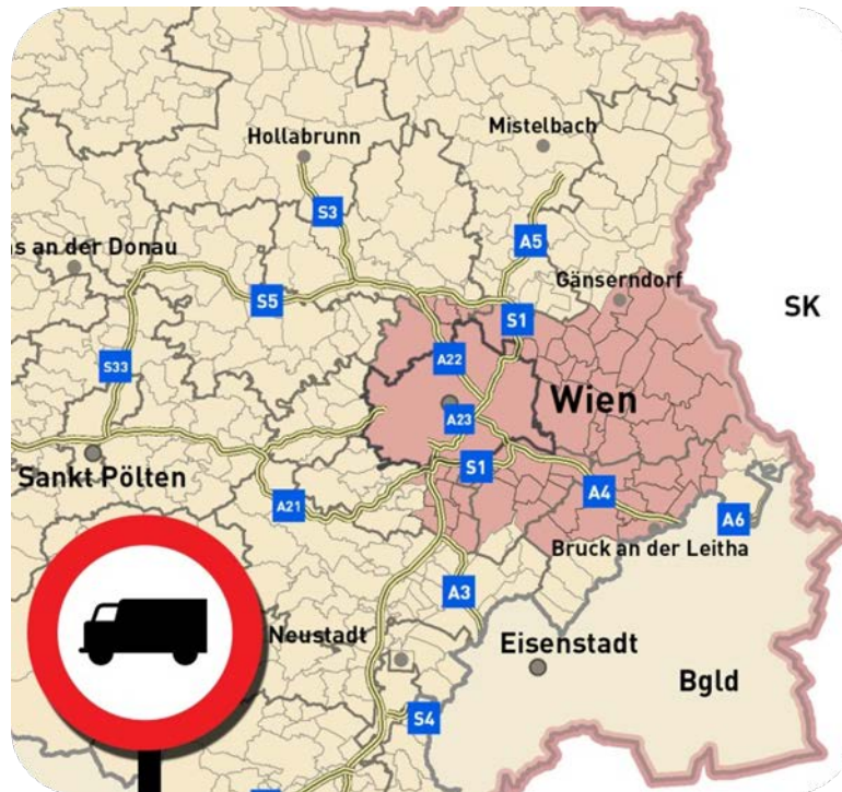
obr. 5 – orientační mapa nízkoemisní zóny – Vídeň a Dolní Rakousko